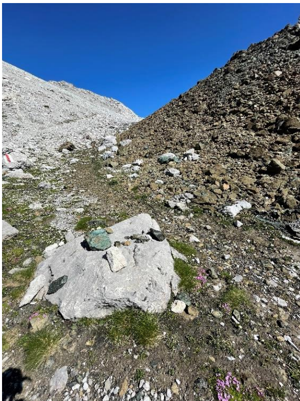
Weissfluhjoch mit weissem Dolomit und schwarzgrünem Serpentin